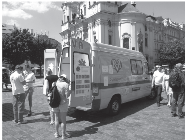
Mobilní ambulance mimo jiné informuje o bezpečnějším sexu a nabízí zdarma testy na HIV.

Testy na zjištění zdravotního stavu mohou být službou zdravotní i sociální. Zájem klientky je zjistit svůj zdravotní stav. Výsledek pak může ovlivnit její soukromí, či následné chování při poskytování sexuálních služeb. Proces tvorby vhodného modelu plánování v organizaci ROZKOŠ bez RIZIKA, respektive jeho administrativní